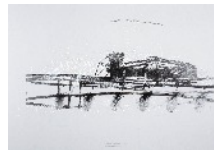
Clas Steinmann dessins, peintures