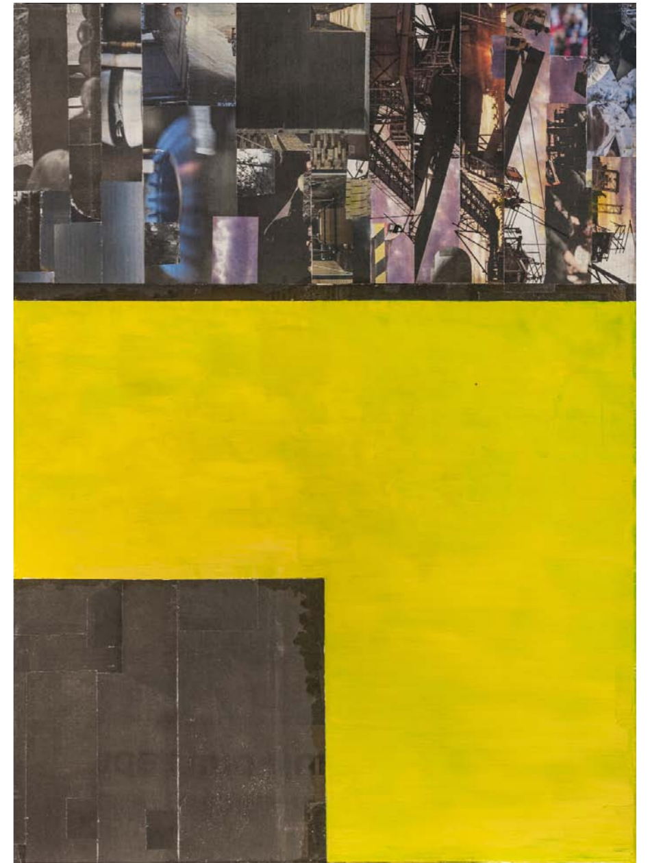
Peinture / Collage - 70 x 50 cm - 2018