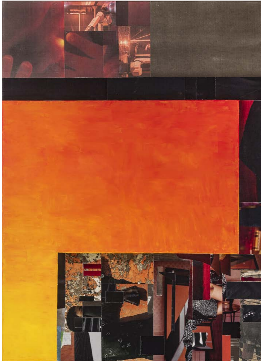
Peinture / Collage - 70 x 50 cm - 2018

Collage became a well-established technique through which contemporary artists, time and again, started to mingle proper painting with new aspirations, allowing them to venture eventually into a new territory, and thus into the realm of conceptual art. The Luxembourg autodidact artist Hubert Wurth is doing exactly this: while in his earlier works he strictly adhered to abstract painting, sticking to a geometry bordering on lyrical abstraction, he moved into developing a new vocabulary, providing the necessary margin to vastly extend his reach beyond mere constructivism. He did not satisfy himself with the known, just the opposite: he was driven towards the unknown. He found his own overtures into hitherto unfamiliar creation in 'art-space' through series aligning networks and grids, joining the complexity of the structure to the depth in space.