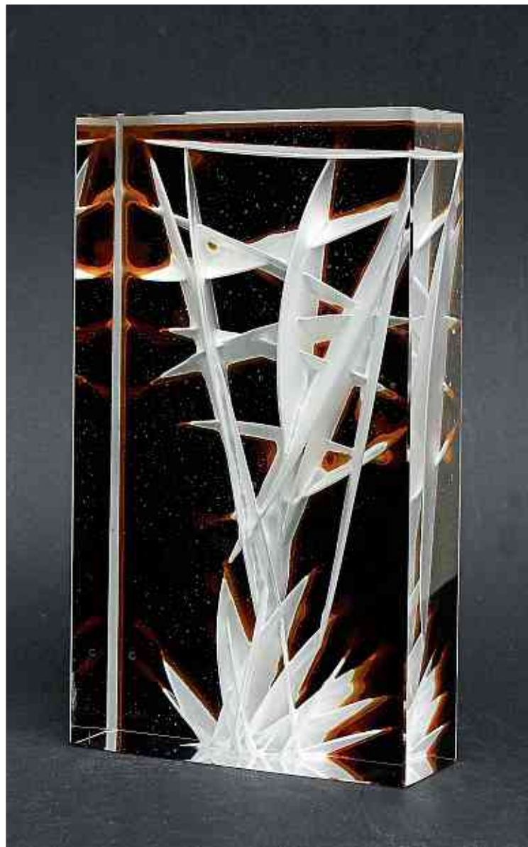
Die Werke von Dainis Gudovskis und Ivo Lill sind bis zum 15. September in der Gallery «Studio Glass Luxembourg» ausgestellt ...