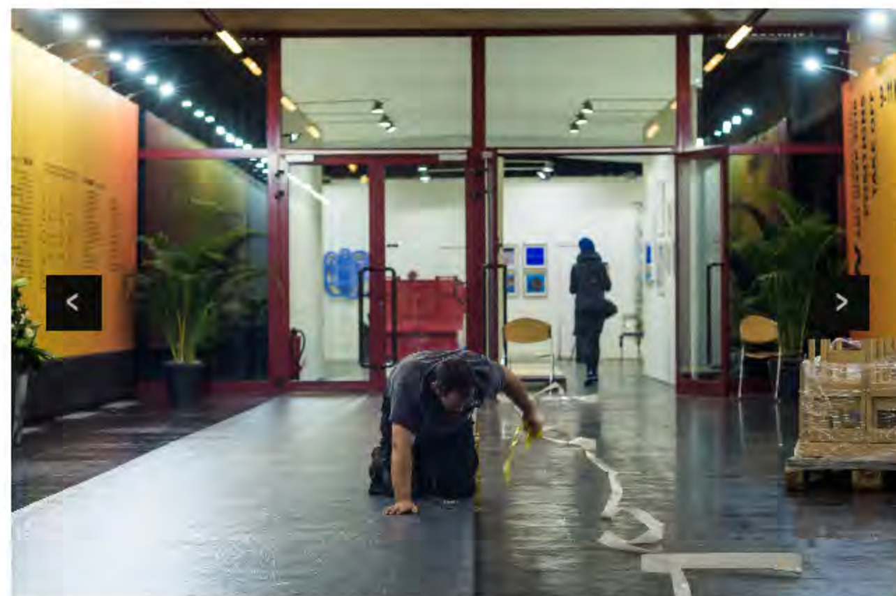
Dans la halle Victor Hugo, les derniers préparatifs sont en cours.