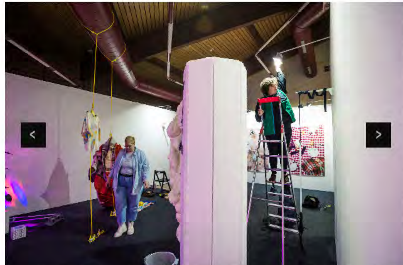
Vue du montage de l'exposition Class trip.

On soulignera que, dans l'ensemble, les stands ont gagné en qualité de présentation, avec des œuvres équilibrées au niveau de la qualité, des médiums, des formats, des prix. Si le niveau était déjà bon les années précédentes pour «Positions», c'est surtout la partie «Take Off» qui gravit une marche. De plus, les amateurs d'art pourront aussi bien trouver une sculpture de Raymond Hains à 85.000 euros (Valerius Art Gallery) qu'un multiple de Robert Barry à 850 euros (Galerie 8 + 4).