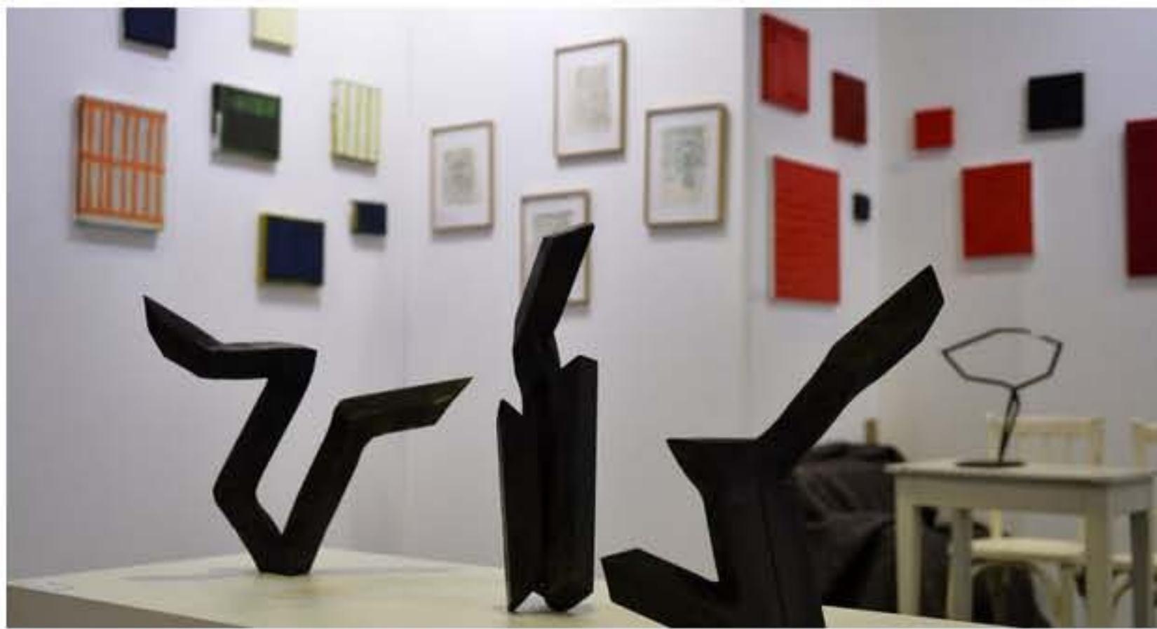
Galleries d'envergure internationale et d'autres, plus modestes, émergentes, s'unissent pour être présentables aux collectionneurs et autres curieux.

Dans Culture, Expos, Luxembourg-Ville Mis à jour le 09/11/16 13:11 | Publié le 09/11/16 13:11