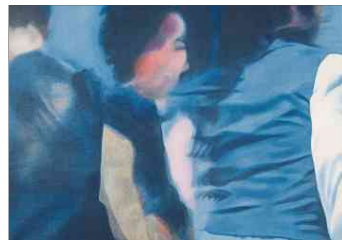
«Danseurs et Gilet Bleu»