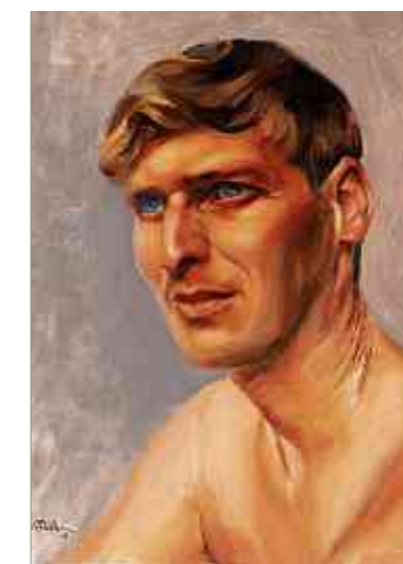
«Christian (I)»

Ein weiteres Medium möchte die junge Frau sich in Zukunft noch weiter und intensiver erforschen: die Malerei. „Natürlich liebe ich meinen Beruf als Grafikerin. Leider muss ich meine reine künst-