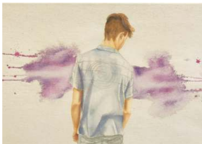
Klang und Stille VI