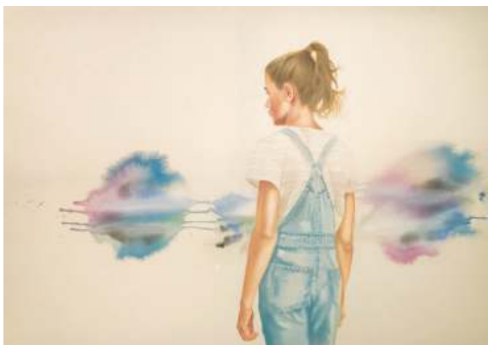
Klang und Stille V