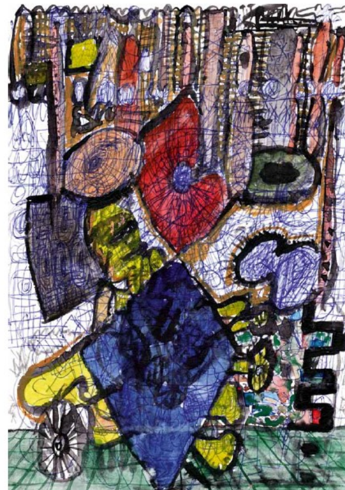
Hört endlich auf zu malen (16 Karat Blattpyramide), Peinture à l'eau + stylo sur papier, 29,7 x 21