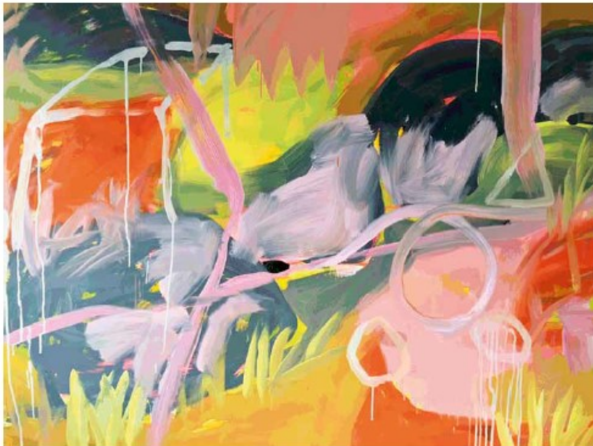
GIARDINI, acrylique, 120 x 140, 2019