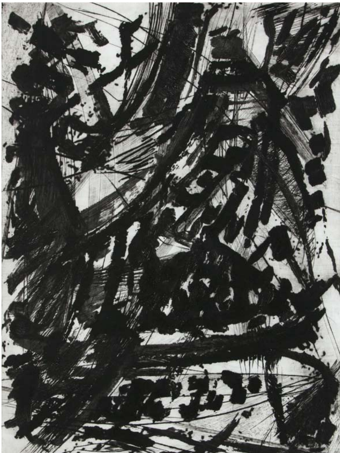
sans titre II pointe sèche et technique mixte 120 x 110 cm