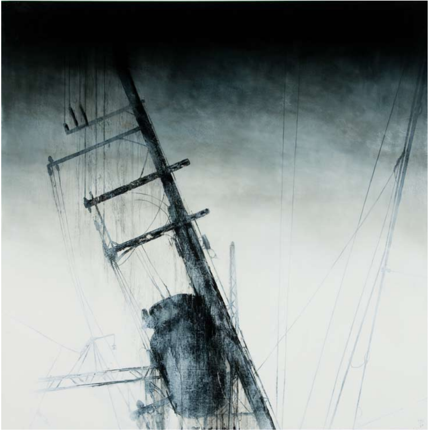
Résilience huile sur bois 120 x 120 cm