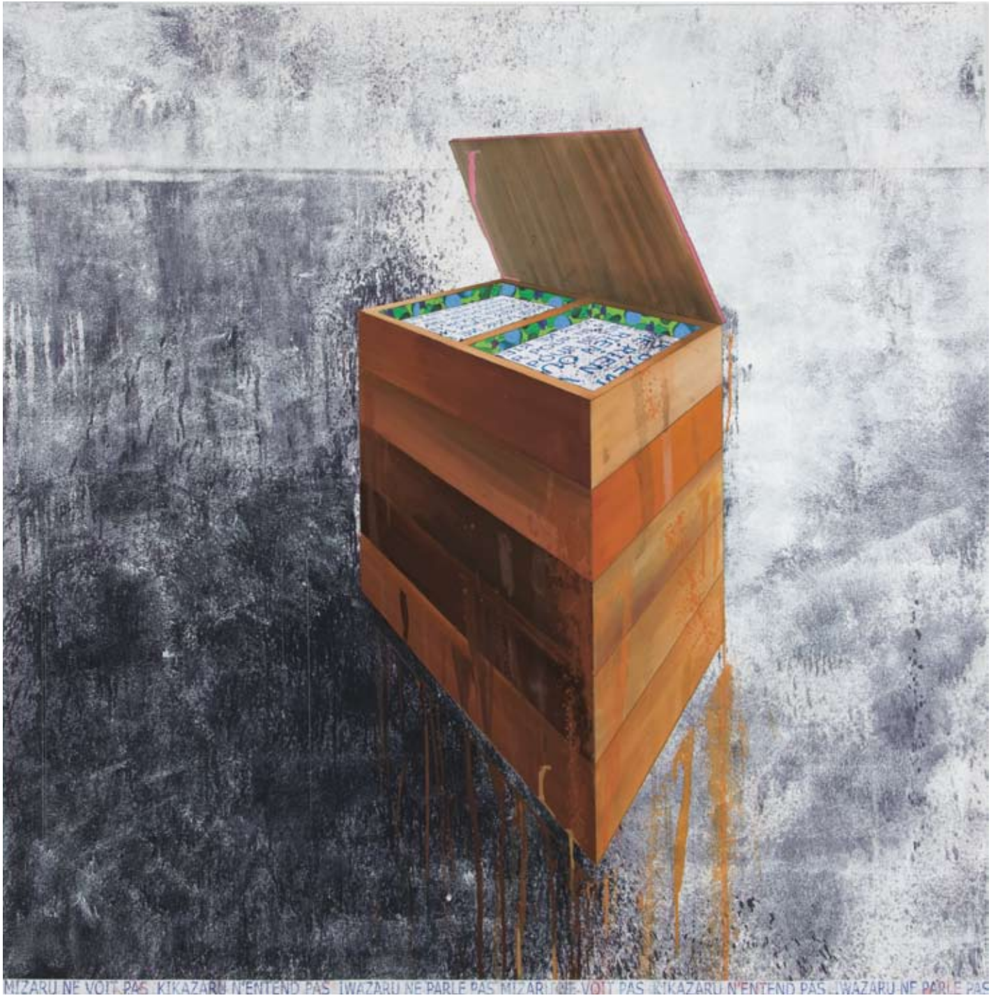
Boîte III technique mixte 150 x 150 cm