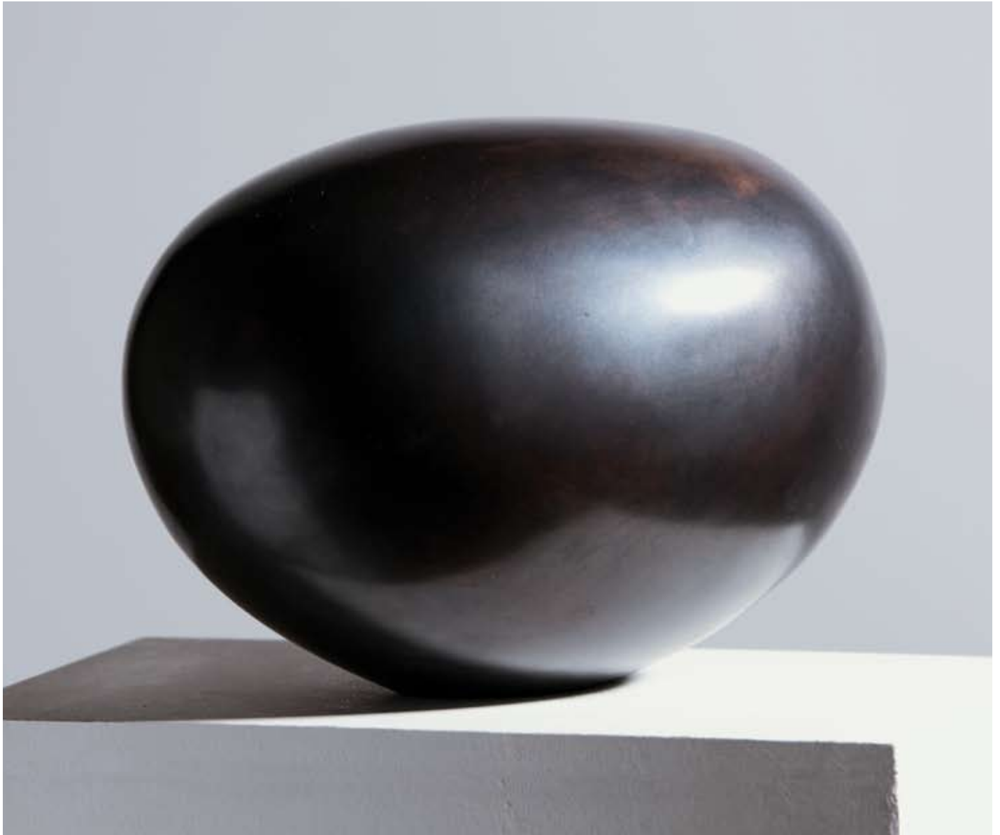
sans titre bronze p.a. 21 x 30 x 22,5 cm