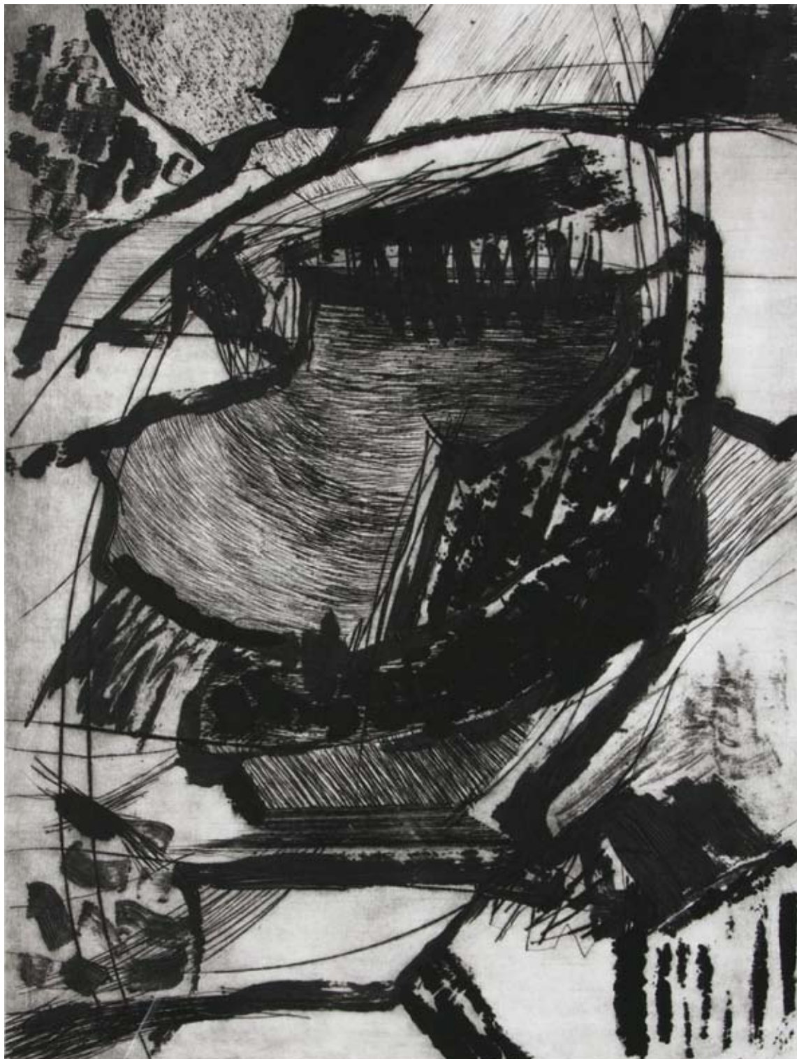
sans titre III pointe sèche et technique mixte 120 x 110 cm