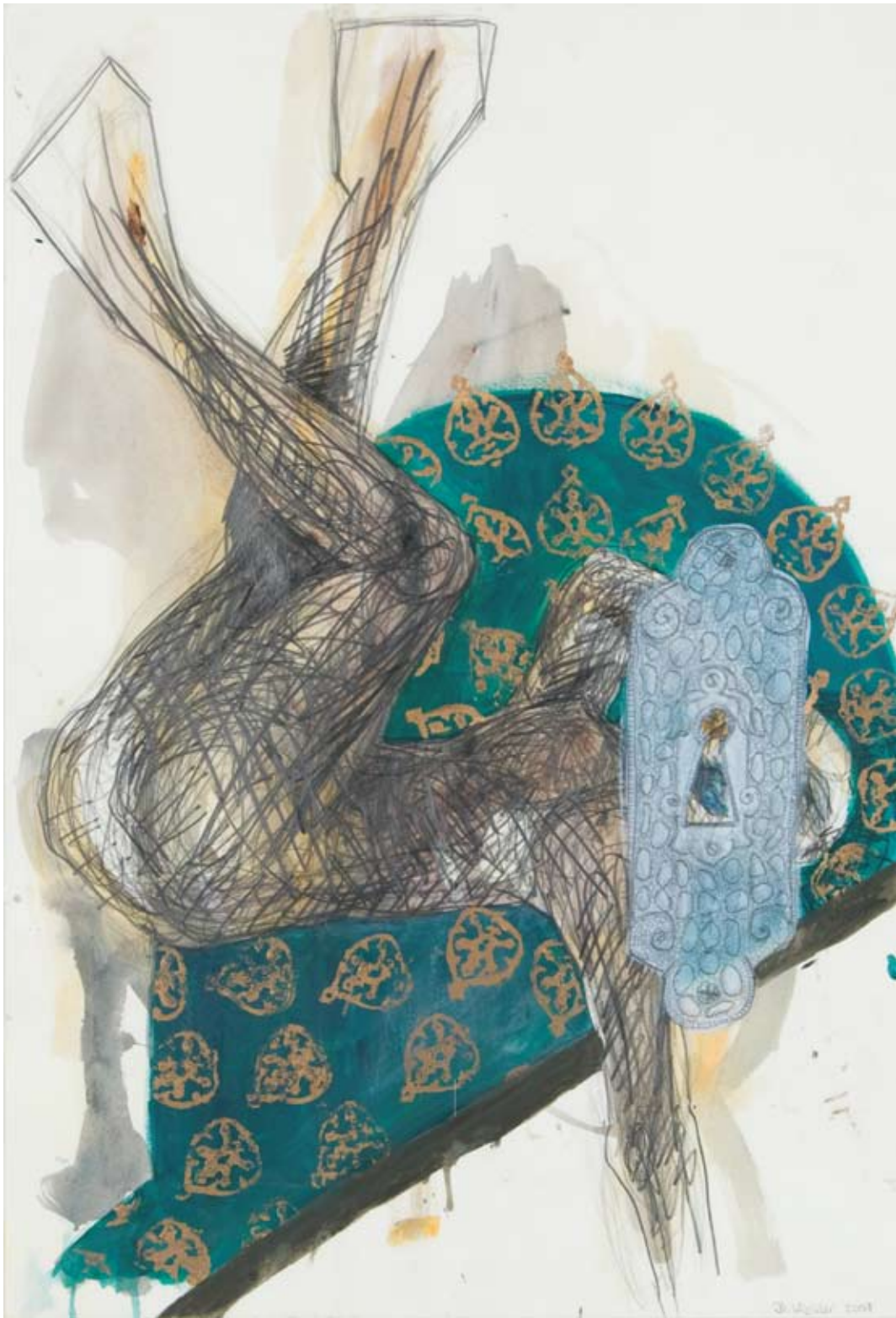
Spion Zeichnung Graphit, Acryl, Goldlack auf Papier 103 x 73 cm