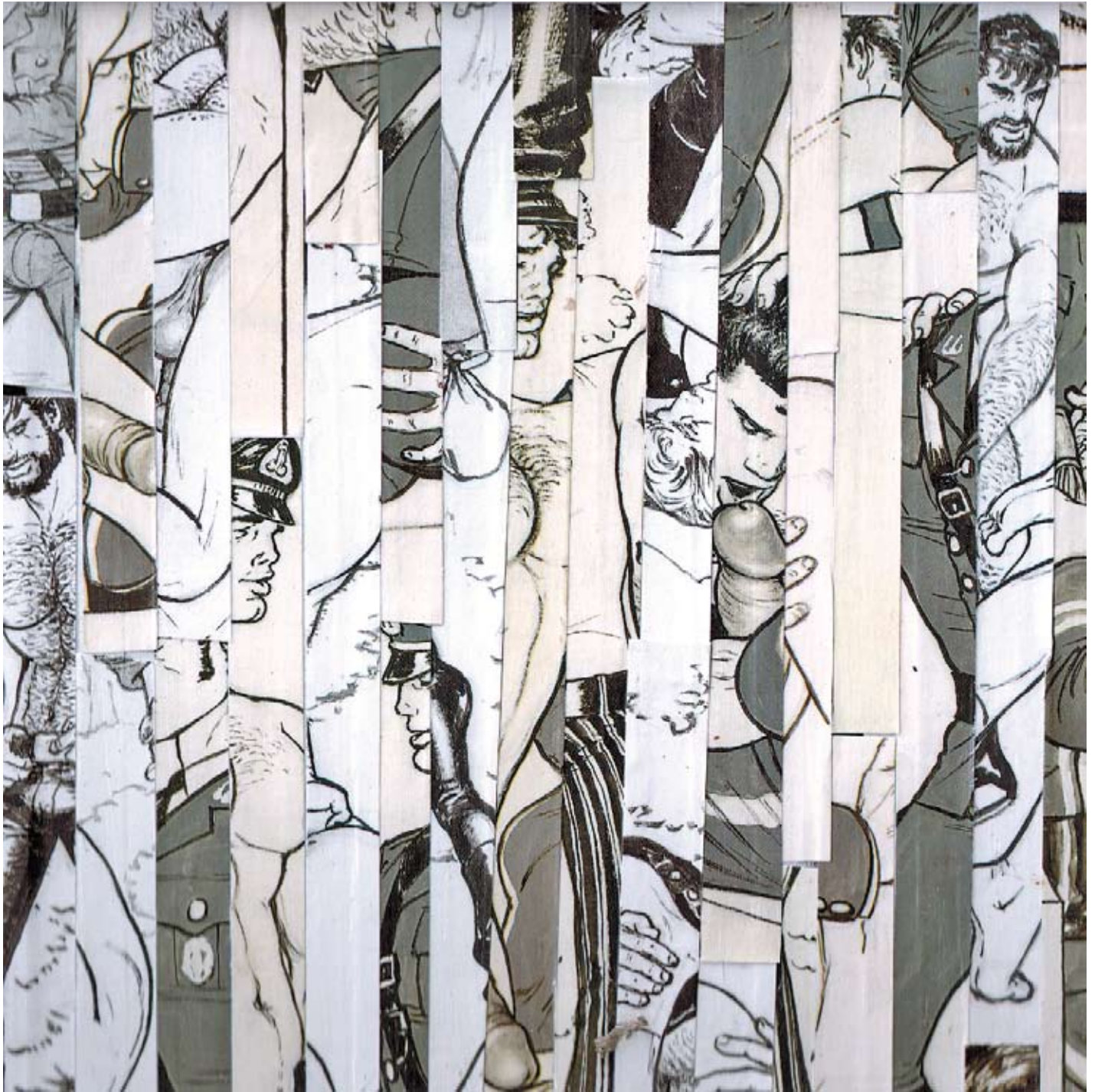
The Complete Kake Comics (excerpt) collage/calico 2008 210 x 210 cm