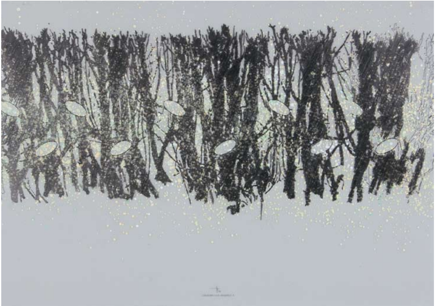
Schneiden und Veredeln R Zeichnung und Acryl auf PE-Folie 100 x 70 cm