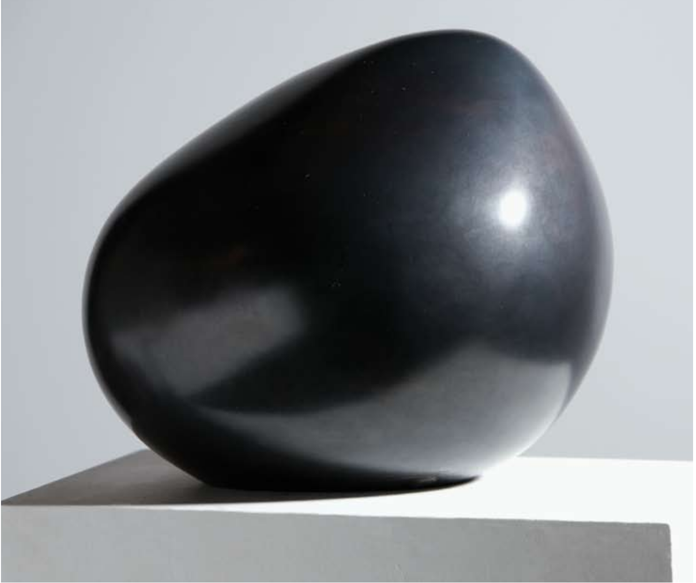
sans titre bronze p.a. 24 x 27,5 x 26 cm