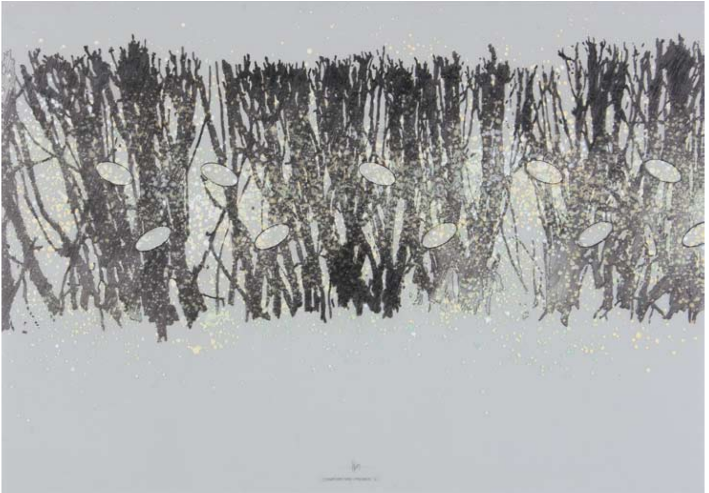
Schneiden und Veredeln L Zeichnung und Acryl auf PE-Folie 100 x 70 cm