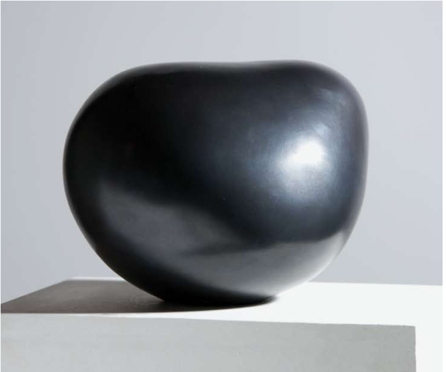
sans titre bronze p.a. 20 x 25 x 21,5 cm