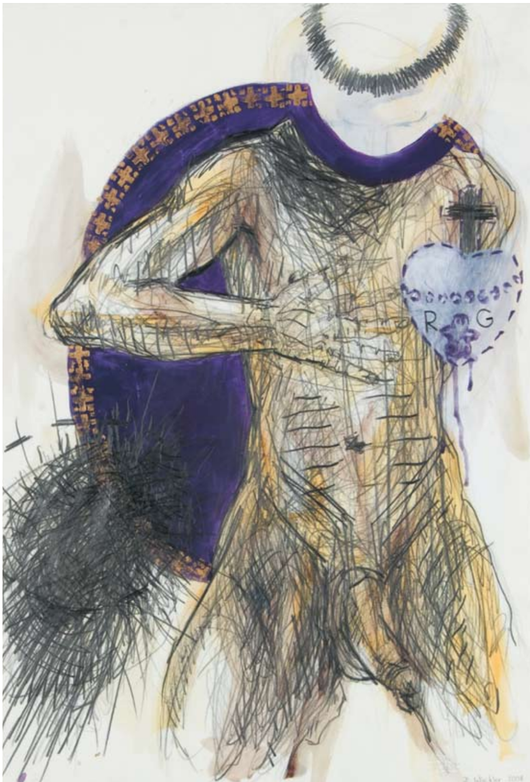
Regina Gratia Zeichnung Graphit, Acryl, Goldlack auf Papier 103 x 73 cm