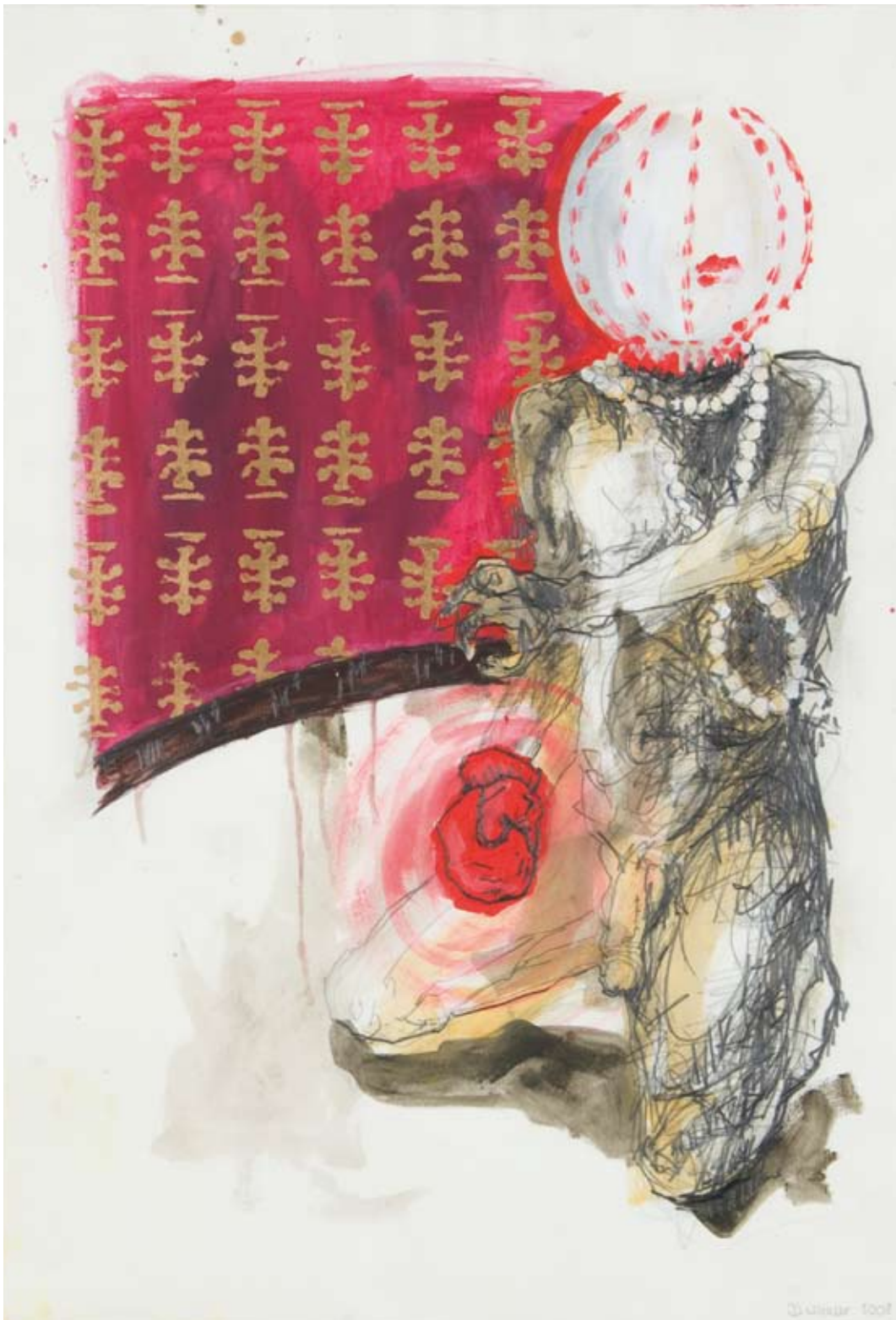
Verteidigung Zeichnung Graphit, Acryl, Goldlack auf Papier 103 x 73 cm