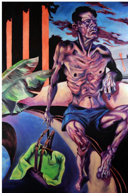
« Delta », huile sur toile, 120 x 80 cm