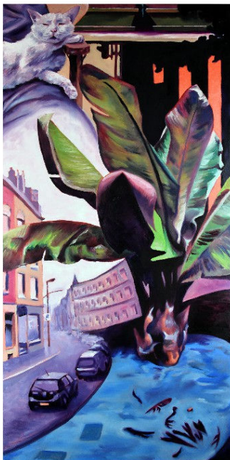
"Omega", huile sur toile, 120 x 60 cm