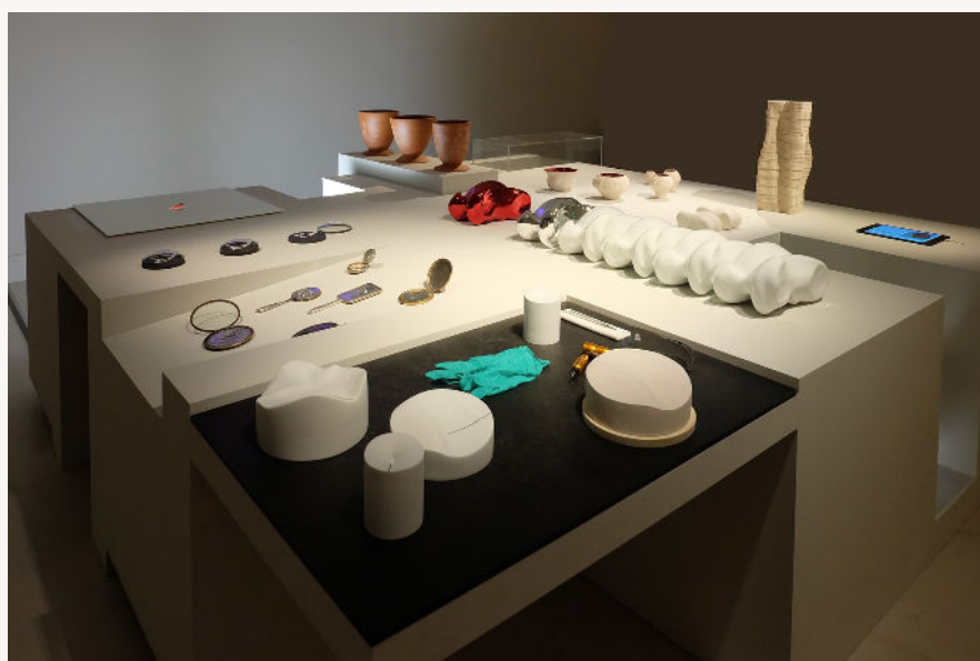
Vue de la table d'exposition de l'ENSA Limoges. © Michel Paysant