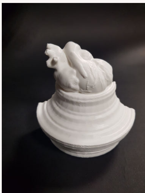
Modèle 3D du projet Multiverre © Servane Blat