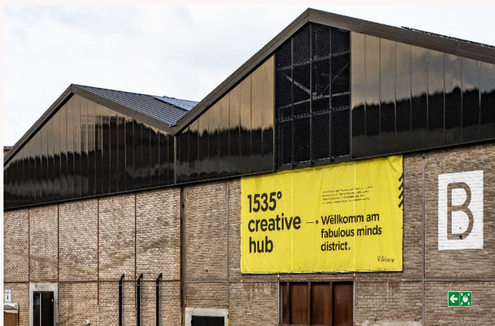
Vue extérieure du bâtiment B @1535 – creative hub

D'une surface d'exploitation totale de 1240 m 2 , le Bâtiment B offre six espaces de création de type « store » et 445 m 2 d'espace polyvalent, le « Hangar », dédiés principalement aux répétitions des arts du spectacle et à des expositions.