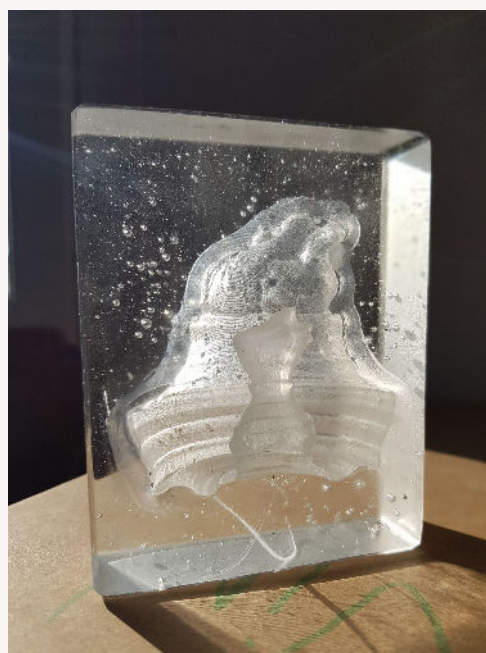
Vue finale du projet Multiverre © Servane Blat