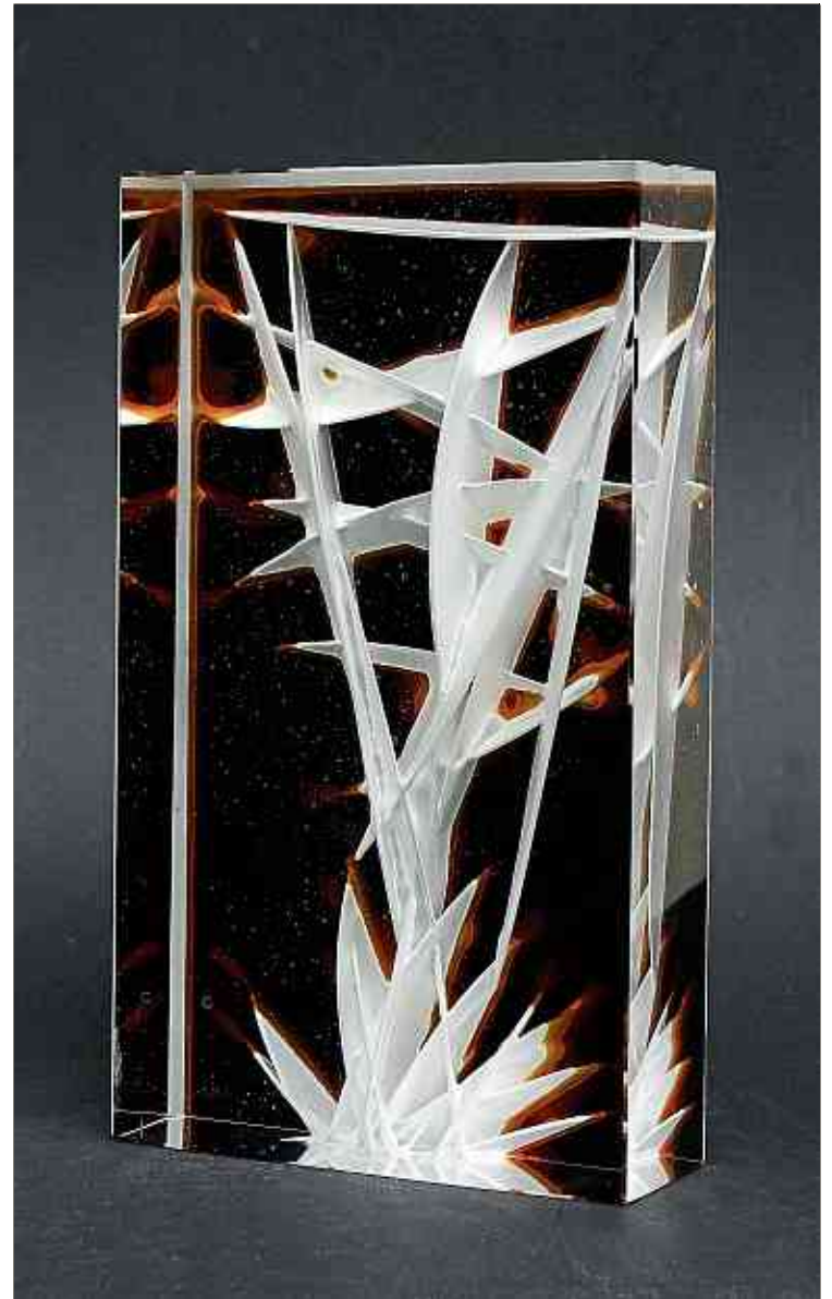
Die Werke von Dainis Gudovskis und Ivo Lill sind bis zum 15. September in der Gallery «Studio Glass Luxembourg» ausgestellt ...