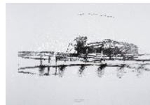
Clas Steinmann dessins, peintures