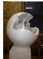
Wouter Van Der Vlugt sculptures