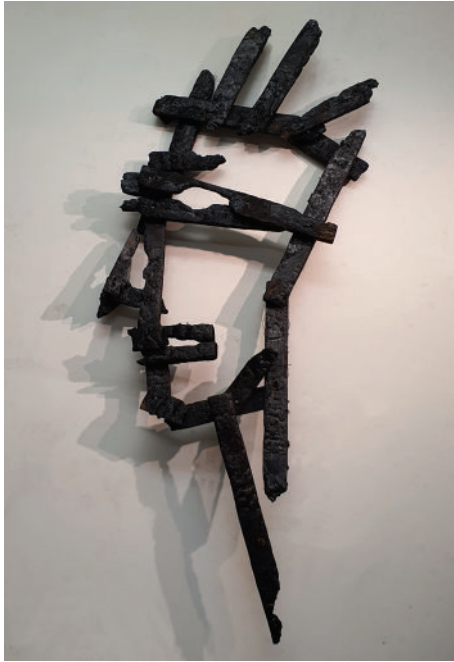
La tête brûlée, 2022 © Florence Hoffmann