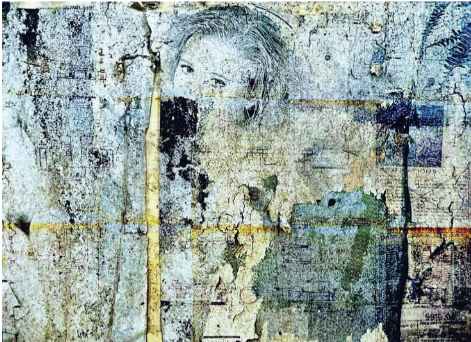
Die Schicht nach der Schicht, 2022 © Patricia Lippert & Pascale Behrens

Le Collège des Bourgmestre et Échevins de la Commune de Schifflange a l'honneur de vous inviter à l'exposition