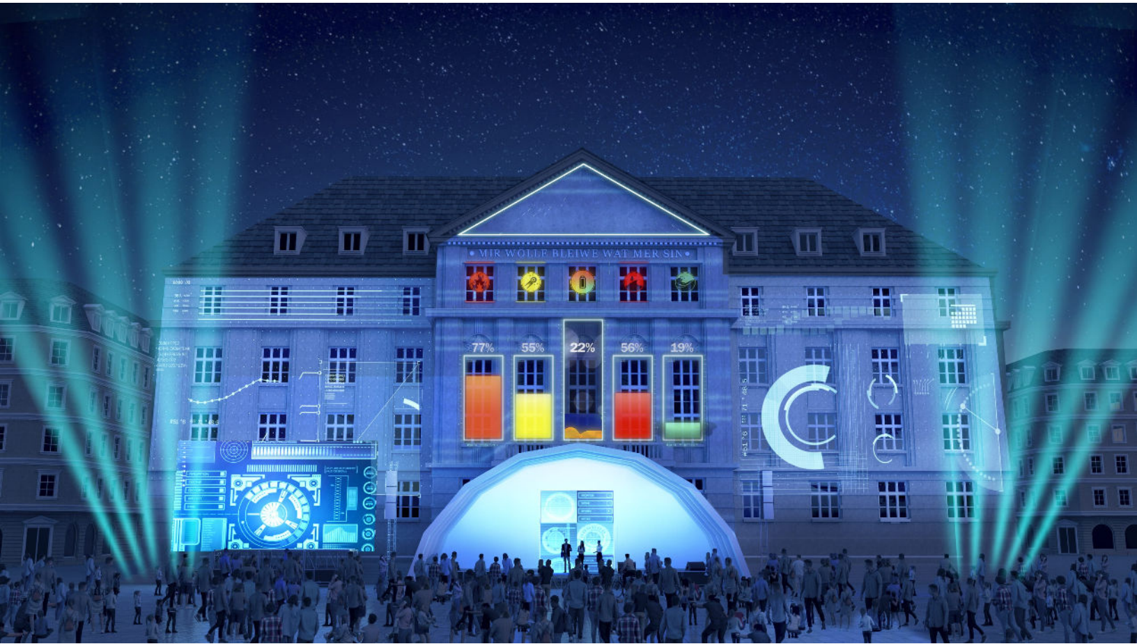
HOTEL DE VILLE