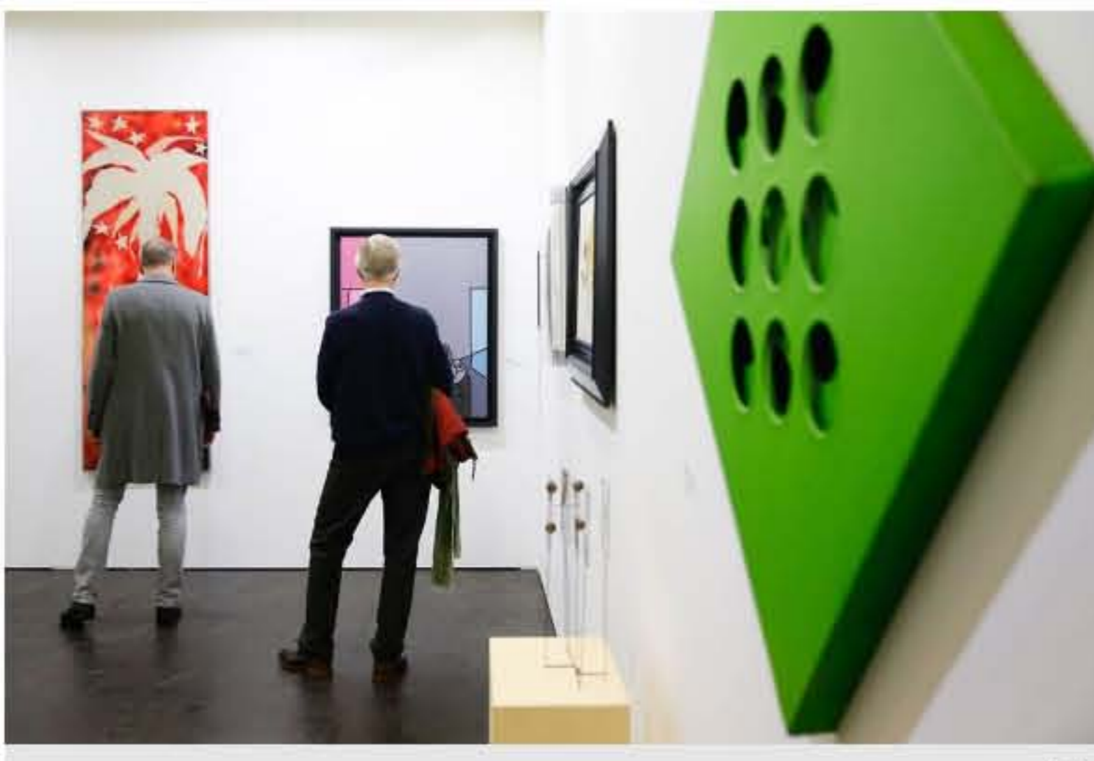
Die Kunstmesse präsentierte eine Mischung aus nationalen und internationalen Galerien und Künstlern.

Auf Bewährtes wurde in diesem Jahr weiterhin gesetzt, etwa die Aufteilung in zwei Sinnabschnitte: International renommierte Galerien stellten ihre Künstler im Bereich „Positions“ aus, Newcomer und freie Institutionen fanden mit „Take-Off“ ihre Bühne.