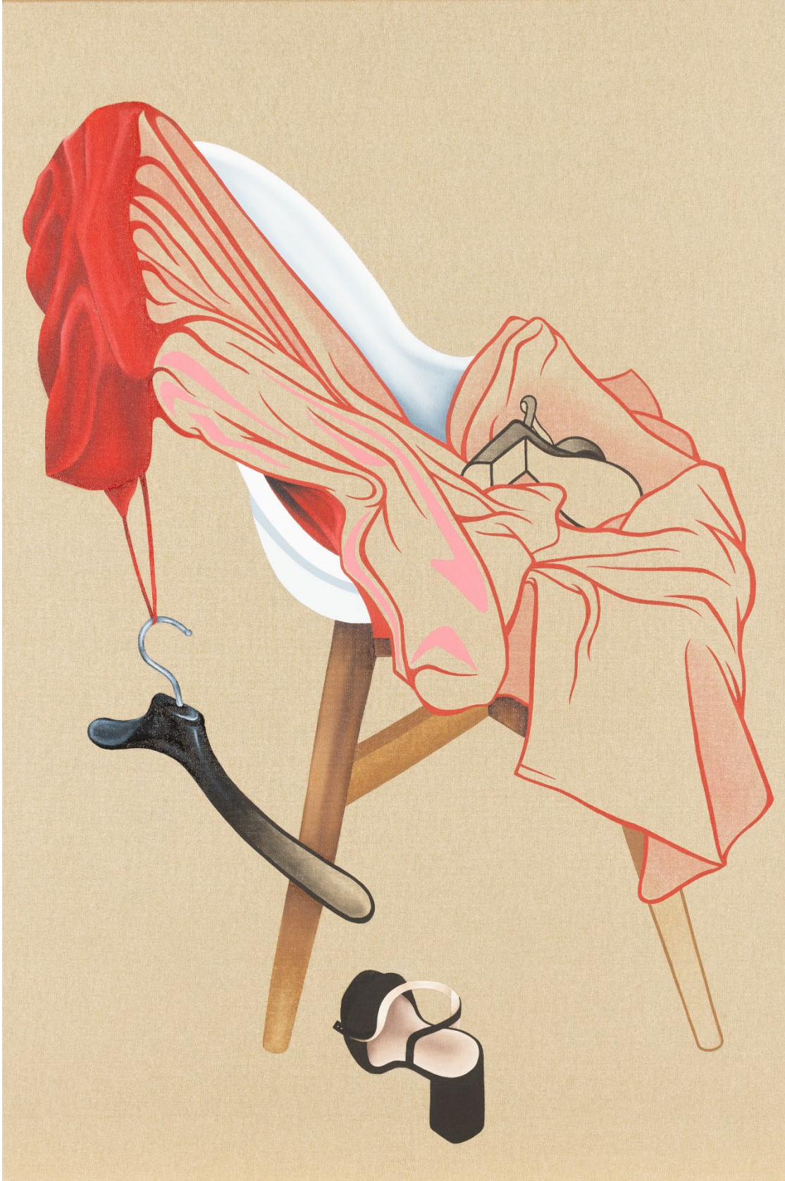
„Lange Nacht“, acrylique et huile sur toile, 120 x 80 cm