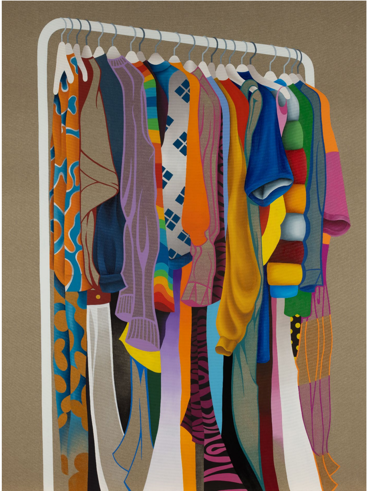
„Julies Garderobe“, acrylique et huile sur toile, 200 x 150 cm