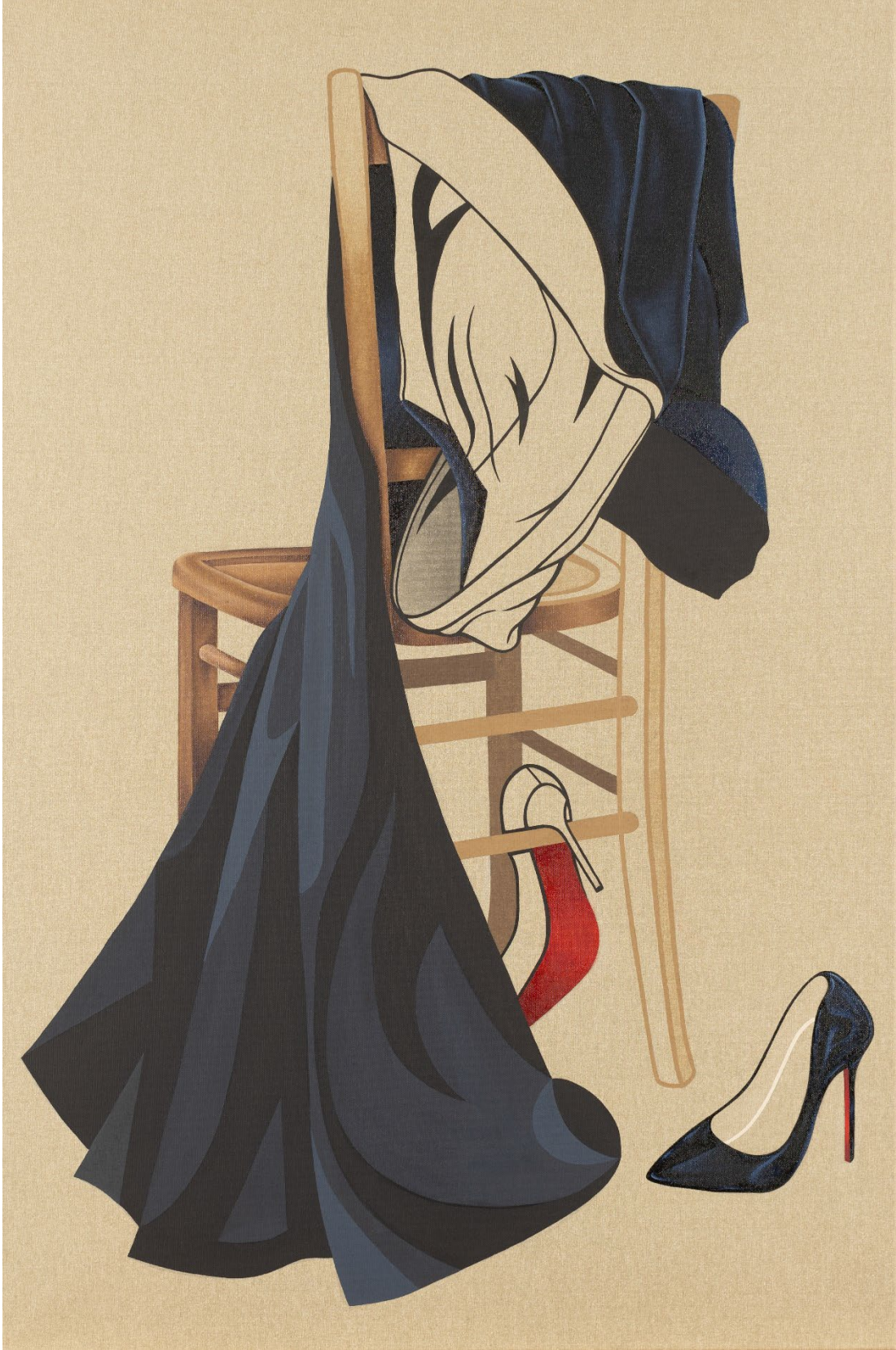
„Nostalgie“, acrylique et huile sur toile, 120 x 80 cm