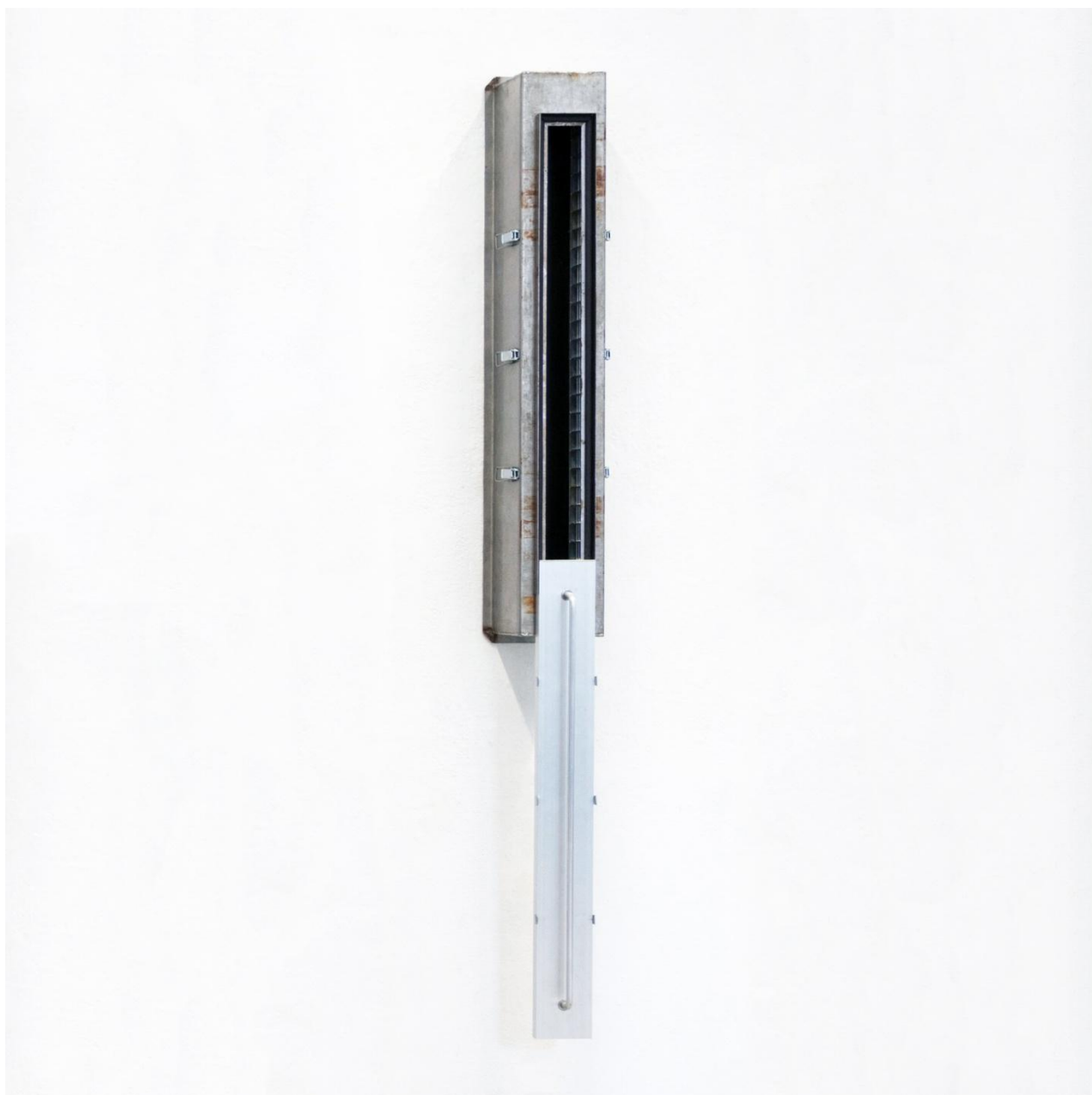
object - 002.1 (2025)

Sculpture (acier inoxydable, acier galvanisé, aluminium et joint caoutchouc), 185 x 19 x 22 cm, ± 12 kg