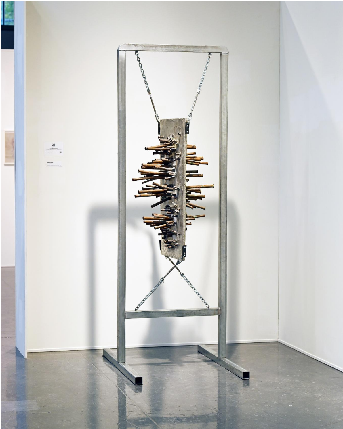
object - 001 (2025)

Œuvres lauréates