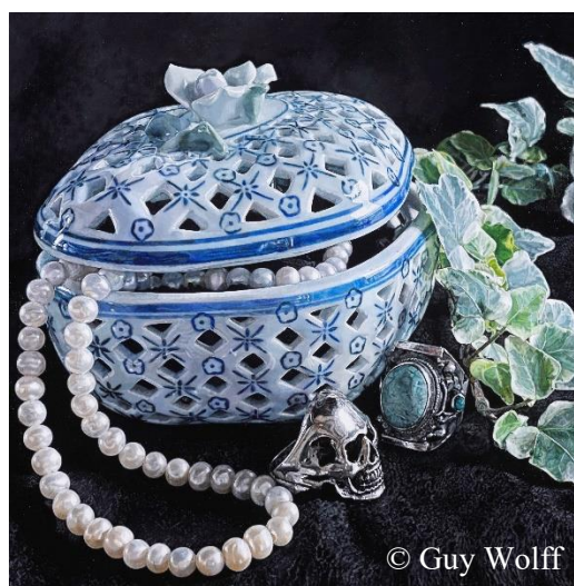
Florence HAESSLER, « Noces de perles », acrylique sur toile, 80 x 80 cm, Salon 2022