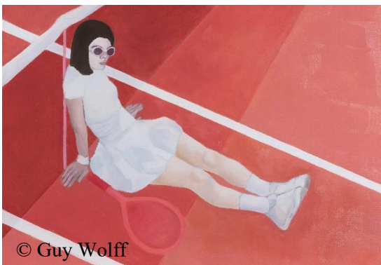
© Guy Wolff Nora JUHASZ, « Un délice à la fois 1 », huile sur lin 70 x 100 cm, Salon 2022