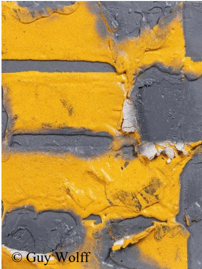
© Guy Wolff Julien HÜBSCH, « roadkill I », yellow street marking tape, spray paint, concrete & wood, 35 x 22 cm, Salon 2022