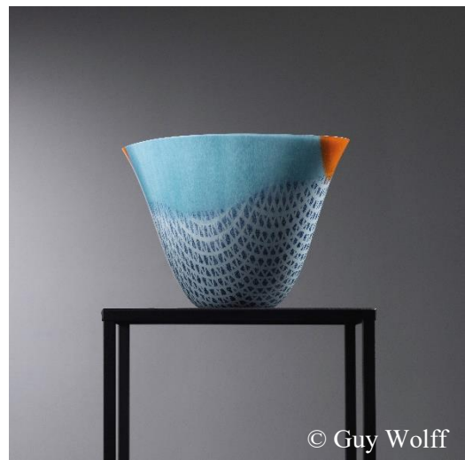
© Guy Wolff Camille JACOBS, « Paysage linéaire 1 » 2021, plusieurs couches de verre, thermocollage, thermoformage, émaillage & polissage, L 33 x H 22,5 x D 23 cm, Salon 2022