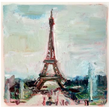
“PARIS: PORTRAITS URBAINS”

“Rapport sur ma résidence d'artiste à la Cité Internationale des Arts à Paris (jan-fev-mars 2023) dans le cadre de la convention entre la Cité Internationale des Arts et le Cercle Artistique de Luxembourg JANVIER-FEVRIER-MARS 2023