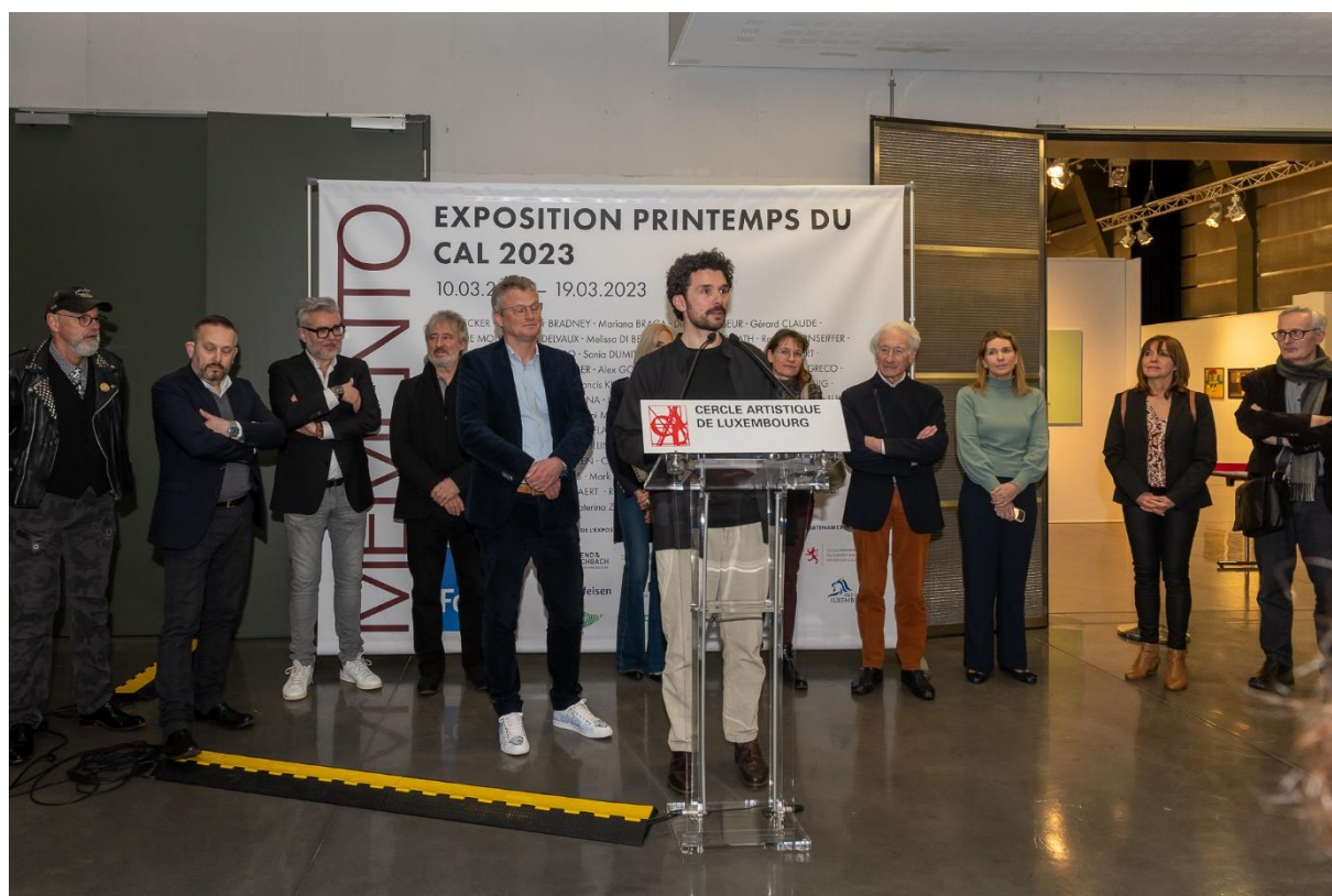
Vernissage de l'Expo Printemps 2023 au Tramsschapp

L'Expo Printemps « Memento » 2023 s'est déroulée au Tramsschapp, Limpertsberg, du 11 au 19 mars 2023. Le vernissage a eu lieu le vendredi 10 mars 2023.